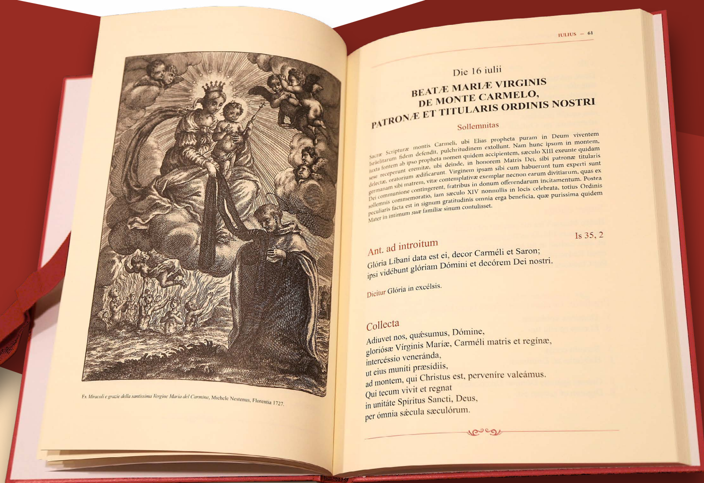
Ex Miracoli e grazie della santissima Vergine Maria del Carmine , Michele Nestenus, Florentia 1727.