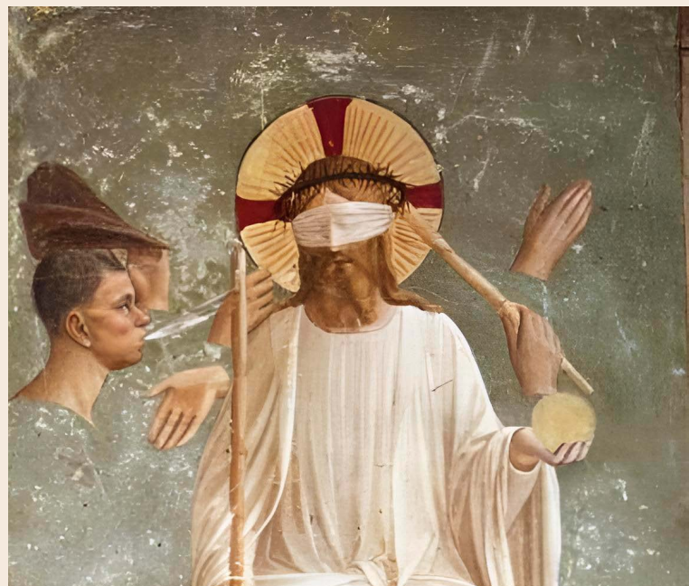
© Fra Angelico - Convento di san Marco

difficiles à guérir. La victime doit recourir à une aide psychologique ou psychiatrique pour surmonter le traumatisme d'un abus sexuel survenu dans l'un des contextes susmentionnés.