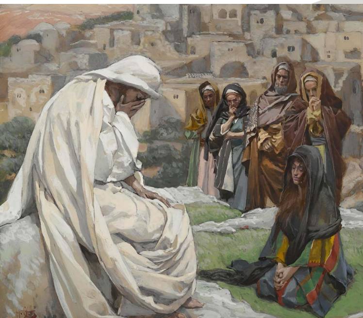
James Tissot - Jesus Wept