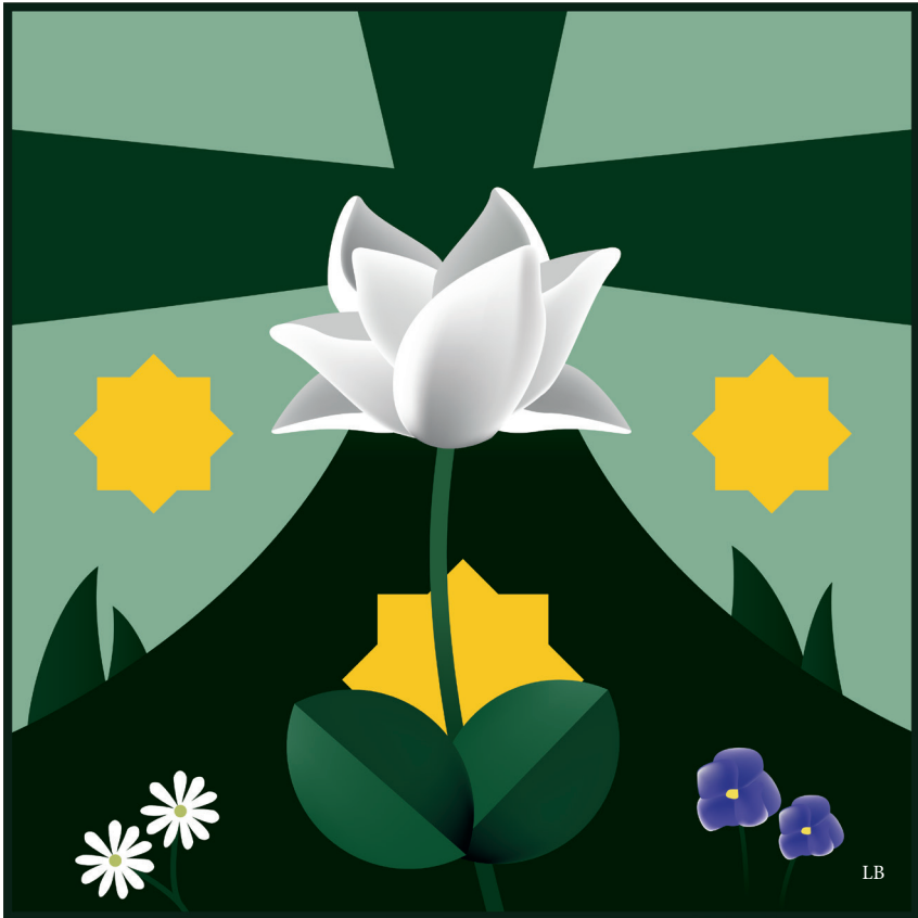
Fiche 6 : Sur les flots de la confiance et de l'amour (Ms A, 80r-81v)