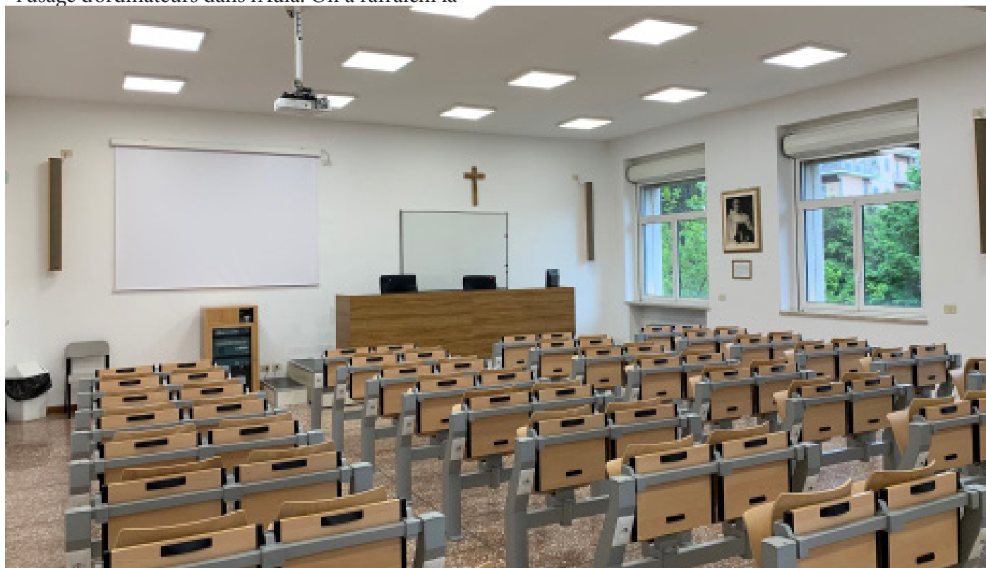
table de présidence et on a amélioré et augmenté l'installation audio. De plus, on a installé un vidéoprojecteur professionnel et deux écrans de télé avec microphones incorporés pour la retransmission en direct et l'enregistrement d'événements en qualité HD. L'Aula 1 est maintenant connectée avec l'Aula Magna, de manière qu'elle puisse être utilisée comme un espace supplémentaire au cas où celle-ci est complètement occupée.

Ainsi, on a changé tous les bancs de l'Aula, remplacés par d'autres avec des prises pour l'usage d'ordinateurs dans l'Aula. On a rafraîchi la